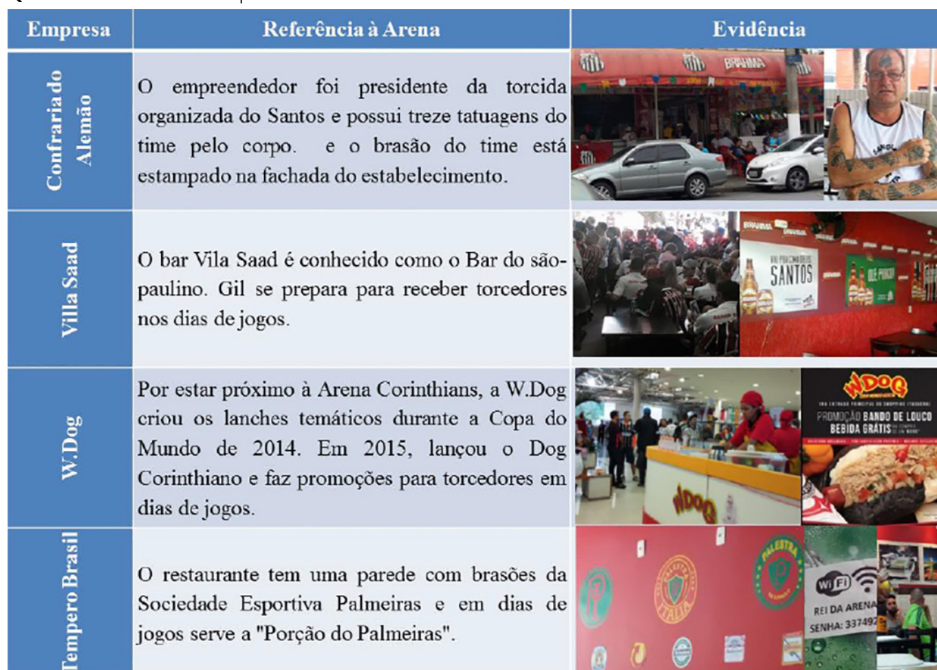
Quadro 5 – Referência Empresas e Arenas