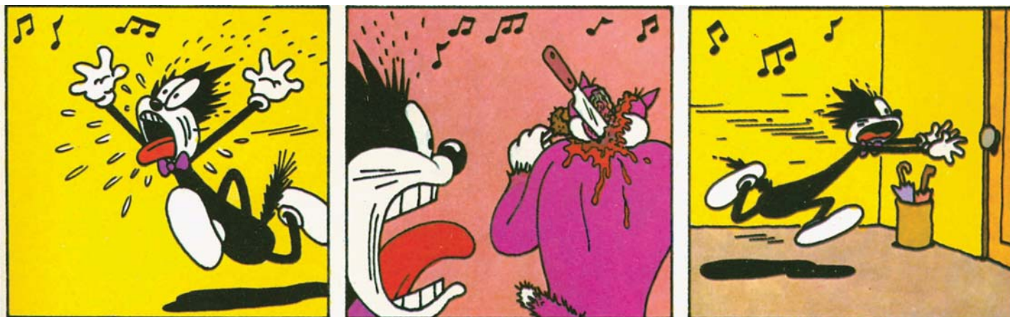
Figura 2: Squeak The Mouse , de Mattioli: sexo e violência com desenhos infantis

imaginação desses artistas surgiram narrativas pouco convencionais: Nazário criou a história Anarcoma , protagonizada por um detetive travesti; depois de fazer as aventuras de Gustavo , personagem antropomórfico que se opunha à opressão da sociedade, Max deu vida a Peter Pank , que misturava o desenho animado de Walt Disney ao movimento punk , em histórias violentas e eróticas; o estilo retrô de Torres remetia aos quadrinhos de linha clara feitos por Hergé e às peças publicitárias dos anos 1940 (seja no design de automóveis, mobília e prédios, seja no que concerne a penteados e figurinos), mas as histórias eram repletas de ironia e ambientadas em cenários futuristas, a exemplo de Triton .