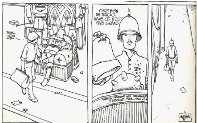
Figura 1: A ficção científica fora dos padrões estabelecidos, no traço de Moebius

Em 1972, artistas que integravam a revista Pilote , como Gotlib e Mandryka, romperam com esse periódico e lançaram o título L'Echo des Savanes , que publicava quadrinhos de humor com uma postura mais radical. Três anos depois, os quadrinistas Moebius (pseudônimo de Jean Giraud) e Drulillet formaram o grupo Les Humanoïdes Associés e criaram a revista Metal Hurlant . Editada até 1987, trazia em suas páginas quadrinhos autorais de fantasia e ficção científica. Mesclando o estilo da linha clara – tradicionais na produção franco-belga – com hachuras, as histórias mostravam cidades futurísticas sujas e planetas desérticos hostis, tendo como protagonistas personagens sem o perfil do herói tradicional. Mas, apesar do sucesso editorial – havia edições em vários países europeus e nos Estados Unidos, onde recebeu o título Heavy Metal , que continua a ser publicado – e da influência que teve em artistas de vários países, a Metal Hurlant não conseguiu sobreviver aos anos 1980. Esse período foi marcado pelo desaparecimento das revistas periódicas de quadrinhos na França, substituídas por álbuns de quadrinhos vendidos em livrarias.