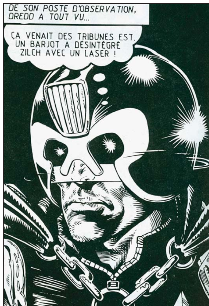
Figura 4: Violência urbana e autoritarismo são as tônicas das histórias de Judge Dredd

Nos Estados Unidos, o mercado editorial de histórias em quadrinhos comerciais vivia, no começo dos anos 1980, uma retração. Mas a proliferação de graphic novels – publicações de quadrinhos voltadas para o público adulto que apresentavam inovações gráficas, narrativas e temáticas – impulsionou a venda de histórias em quadrinhos com a formação de um novo público e o resgate de antigos leitores. Popularizado pelo veterano Will Eisner a partir da publicação do livro de quadrinhos Um contrato com Deus , o termo “romance gráfico” foi empregado para designar produções autorais (mesmo que muitas obras fossem realizadas por editoras comerciais) vendidas em livrarias. A esse