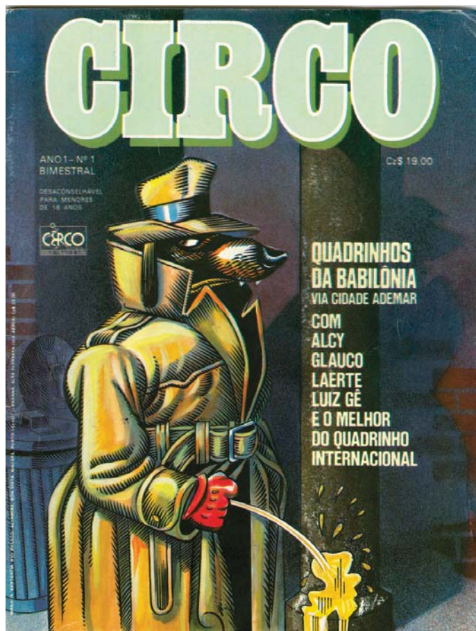
Figura 5: Capa da primeira edição da revista Circo , concebida por Luiz Gê

crescida durante a ditadura, não era despolitizada, mas soube abrir-se “para questões que não constavam do programa da esquerda tradicional”. Para esse autor, “o surgimento de um espírito humorístico, desconchavado, celebratório, num ambiente ainda coberto de pessimismo e amargura, não são características tão ‘despolitizadas’ assim”.