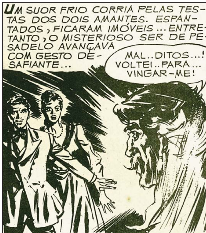
Figura 7: O terror na visão de Rodolfo Zalla

Inicialmente, essa casa publicadora colocou nas bancas álbuns de quadrinhos de aventura e western realizados por artistas europeus, como o bárbaro Thorgal (cujas histórias eram escritas pelo belga Jean Van Hamme e desenhadas pelo polonês Grzegorz Rosiński) e Durango (criado pelo belga Yves Swolfes). Essas publicações, contudo, tiveram vida efêmera – quatro e três edições, respectivamente.