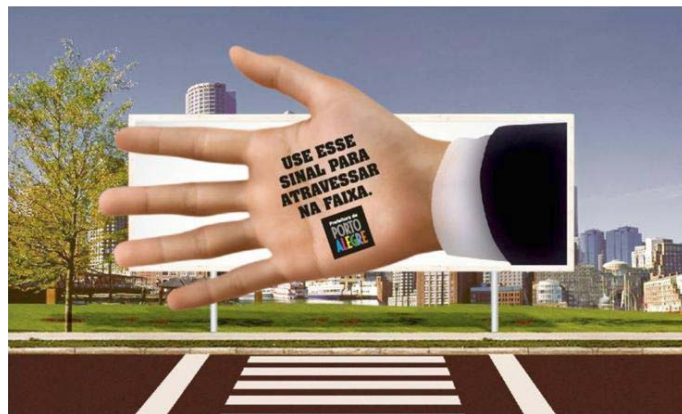
Figura 1: Outdoor com aplicação da Campanha "Novo Sinal"

seadas no novo sinal, no canal virtual YouTube.