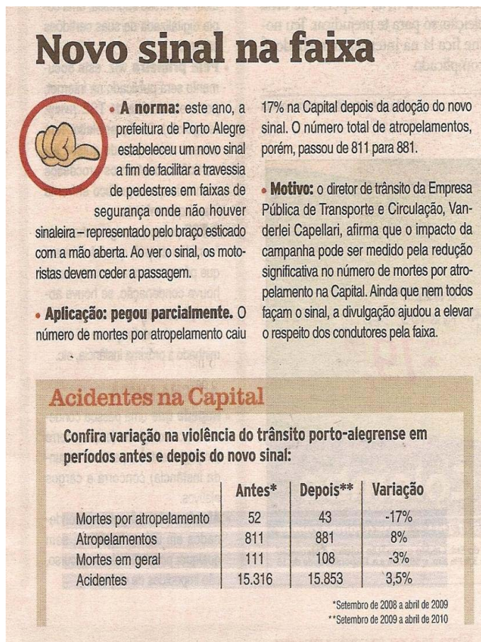
Figura 4: Avaliação do Programa “Novo Sinal” em reportagem da mídia

O indicador de avaliação pela mídia pode ser ilustrado na Figura 4, de Gonzatto (2010), que realiza, diretamente, uma avaliação a respeito do Programa “Novo Sinal”, classificando-o como de parcial sucesso: em comparação de dois períodos determinados, enquanto o número de atropelamentos aumentou em 8%, o de mortes por atropelamento reduziu-se em 17%.