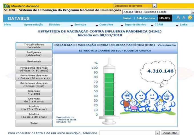
Figura 7: Acompanhamento on-line do total de pessoas imunizadas

Em reunião com os principais envolvidos no programa, assomaram algumas considerações e reflexões acerca de