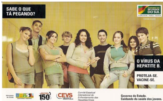
Figura 6: Volante informativo para jovens sobre as hepatites virais

essa variável é sobremaneira cara ao comitê, em função de que a informação à população é determinante para a prevenção, e por se tratar de uma questão complexa – as três formas de hepatites virais presentes no Estado requerem, cada uma, diferentes cuidados, como explanado em um programa de uma hora da TVE, e em duas páginas de uma reportagem do Caderno Vida do jornal Zero Hora , que funcionou “quase como uma cartilha”. Por exemplo, quando a pessoa passa a saber que é uma portadora do vírus, “ela, no mínimo, deixa de ser uma transmissora” do mesmo.