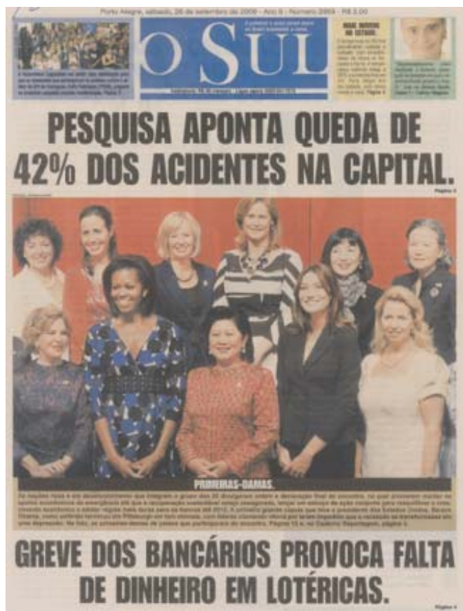
Figura 3: Capa de jornal aponta resultados do programa

Como a Assessoria de Educação para o Trânsito – Asset é de atuação, sobretudo, operacional, não se envolveu no planejamento da campanha, mas o fará a partir de agora, na etapa que é chamada de Fase 2, lançada publicamente no Ginásio Tesourinha, com sketches de teatro e shows musicais. Enquanto a Fase 1 foi precipuamente campanha de informação e persuasão, a Fase 2 reforçará a puni-