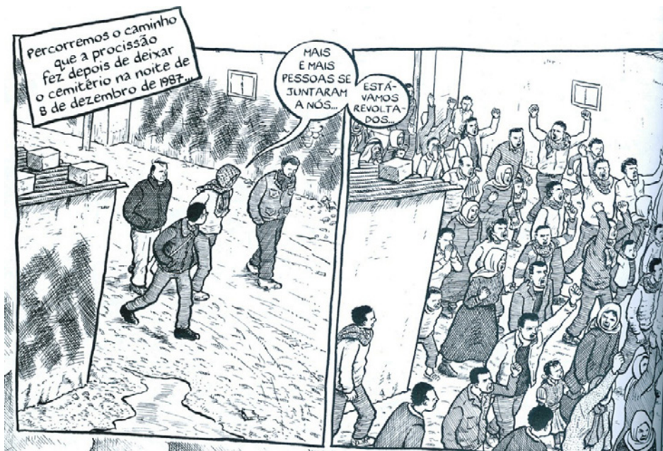
Figura 1. Na primeira vinheta, o repórter acompanha sua fonte, e, na segunda, é mostrada a cena descrita pelo depoente; o balão de fala interliga os dois momentos

No caso de Palestina: na faixa de Gaza , Sacco, ao mesmo tempo que descreve visualmente as condições de vida da população palestina, colhe depoimentos a respeito da intifada (revolta popular) contra o governo de Israel, que ocorreu no final da década de 1980. O repórter representa-se como personagem, expõe suas convicções, ou suas incertezas, e sente-se embaraçado quando uma idosa afirma que há muitas promessas, inclusive de estadunidenses, para mudar a situação e firmar um acordo de paz (Figura 1). Muitas vezes, para cumprir sua agenda, o jornalista aparenta um distanciamento em relação às pessoas e aos fatos que presencia; em outras ocasiões, mostra-se impotente diante daquela realidade.