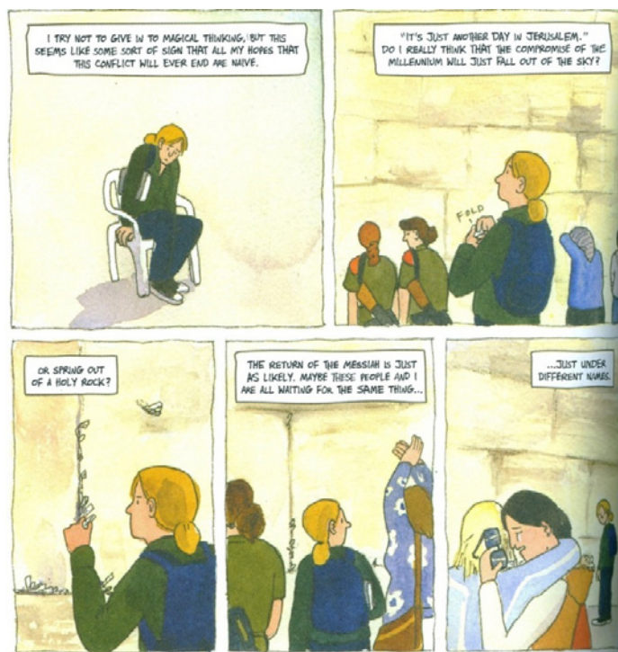
Figura 7. Emoções e dúvidas no Muro das Lamentações