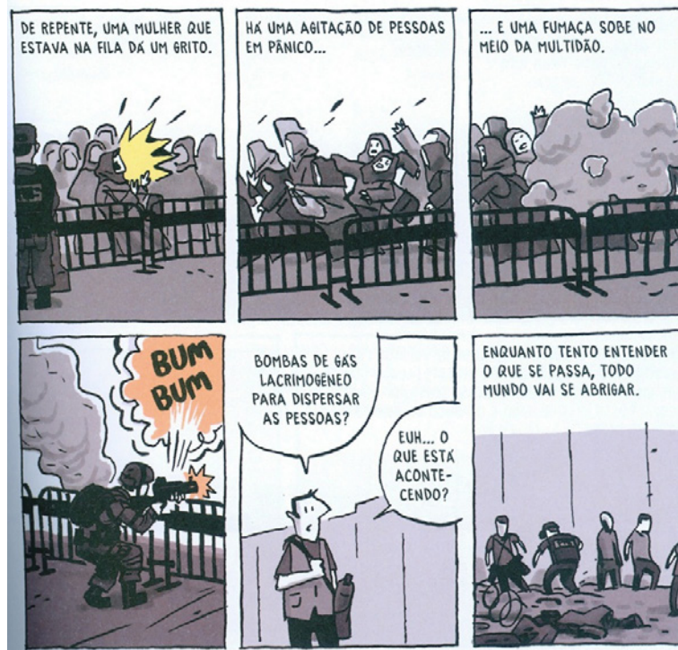
Figura 4. O autor presencia, atônito, incidente na fronteira entre Israel e a Faixa de Gaza