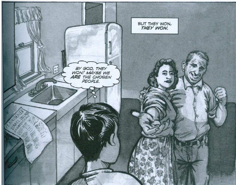
Figura 8. Em suas memórias de infância, Pekar testemunhou a alegria de seus pais quando o Estado de Israel foi criado