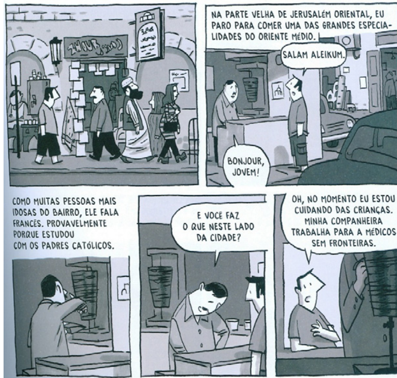
Figura 3. Detalhes do cotidiano: Delisle percorre as ruas de Jerusalém, observa lugares e pessoas e interage brevemente com seus habitantes.

encontram nas vestimentas, nas atitudes, na fala etc. Minúcias do dia a dia ganham uma dimensão maior para seu olhar. O diferente atrai sua atenção, uma vez que ele se sente estranho naquele novo contexto (Figura 3).