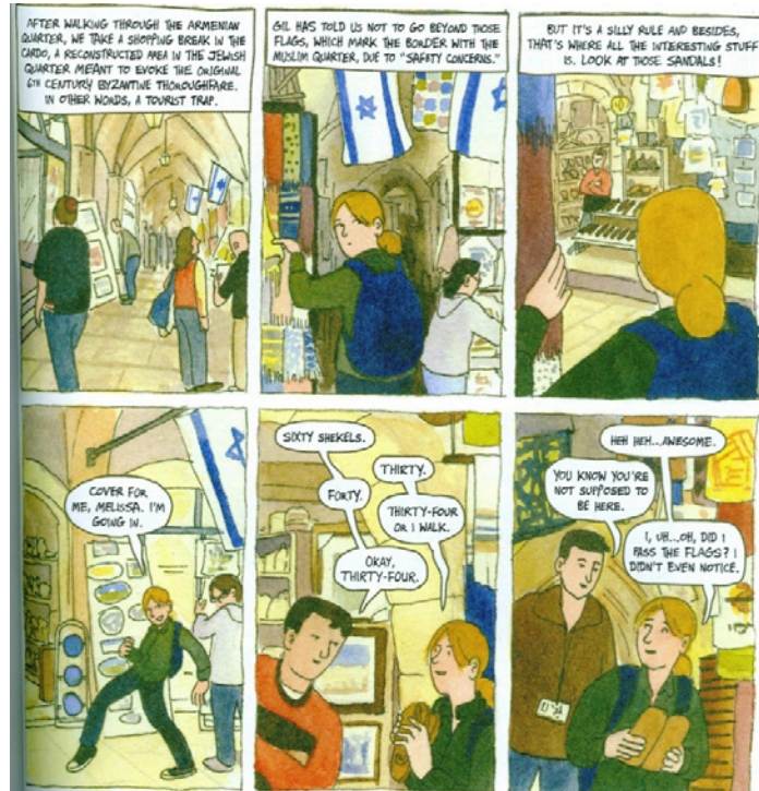
Figura 5. Glidden contempla o lado oriental de Jerusalém e toma coragem para entrar no mercado gerido pelos muçulmanos para comprar sandálias

na Palestina, defende a paz e o reconhecimento dos direitos dos palestinos. Ela decide participar de uma excursão promovida pelo governo de Israel voltada para jovens judeus que moram em outros países. Embora seja cética em relação aos objetivos dessa viagem patrocinada, faz, também, uma jornada para conhecer melhor suas raízes e tentar compreender a realidade atual do lugar. Ao chegar a Israel, e contra todos os avisos contrários, entra no lado oriental do mercado, onde comerciantes muçulmanos vendem suas mercadorias, mas sem antes misturar ironia e receio pela ousadia (Figura 5).