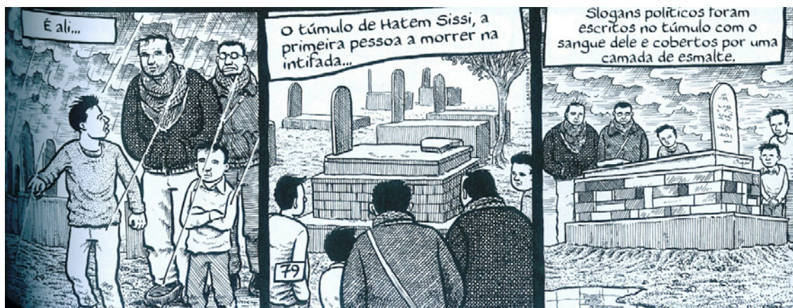
Figura 2. Sacco (ao fundo da primeira vinheta) descreve visualmente o túmulo da primeira vítima da revolta palestina de 1987