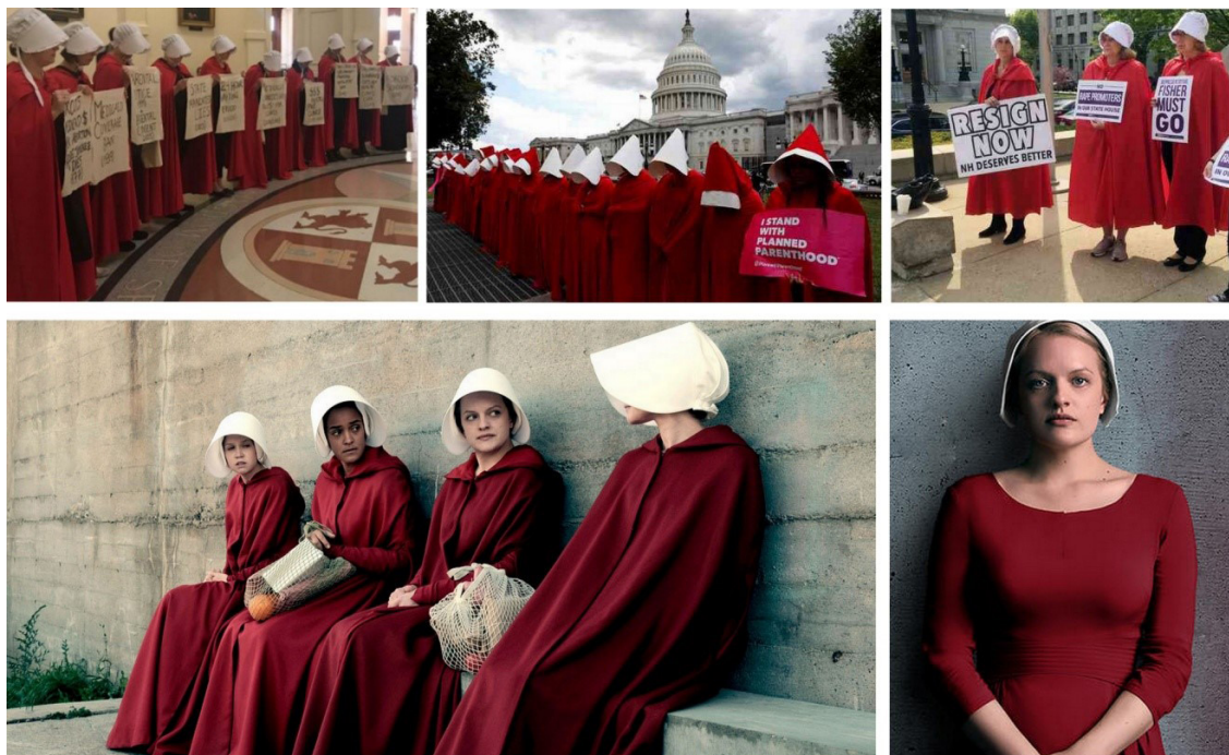
Figura 3. Em sentido horário, vemos os protestos no Texas, Washington e Nova Hampshire, respectivamente. Na parte debaixo da imagem vemos as cenas da série The Handmaid's Tale