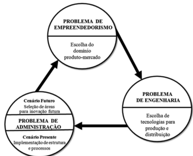
Figura 1 – Ciclo de adaptação da organização ao ambiente externo

Fonte: Adaptado de Miles e Snow (2003, p. 24).