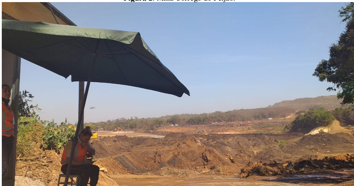
Figura 2: Mina Córrego do Feijão.