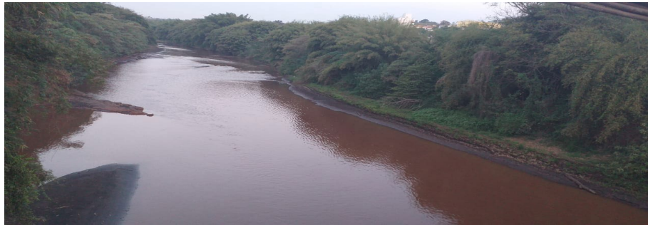
Figura 3: Rio Paraopeba-Brumadinho/MG.

e resíduos ocasionados pelo epicentro de impacto causado pelo rejeito que escoou da Barragem I, do Córrego do Feijão.