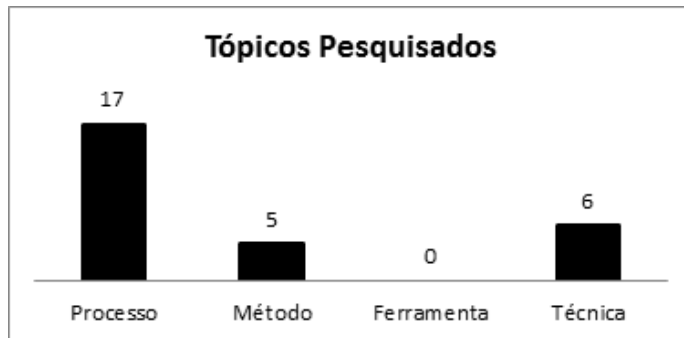
Figura 2 - Quantidade de Estudos por Tópico Pesquisado

uma adaptação de processos já existentes. Dentre as técnicas obtidas, a maioria está relacionada ao desenvolvimento de interfaces e ao levantamento de requisitos.